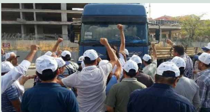
Darphane işçileri diyor ki: "Grev çadırımıza gelenlerin desteği bizim için çok önemli. Gelemeyenlerin de yapabileceği bir şeyler var. Bozuk paralarınızı grev bitene kadar evlerinizde biriktirin."

Darphane Damga Matbaası'nda altından, madeni paraya, nüfus cüzdanından, araç ruhsatına, ehliyetten pasaporta bir dizi başka şey de basılıyor. Emniyetin, elinde sadece Eylül ayının ortasına kadar yetecek pasaport stoğu kaldığını açıklamayı, hac döneminin ve uzun bayram tatilinin yaklaşmakta olduğunu düşününce pasaport basımı yönetimin en çok sıkıştığı alanlardan birisini oluşturuyor. Yönetim sıkıştıkça, bizzat Faruk Çelik tarafından grevci işçiler hedef gösteriliyor, grev hakkında bir dizi yalan haberler yayılıyor. Darphane yönetimi ve hükümet işbirliği ile ger-