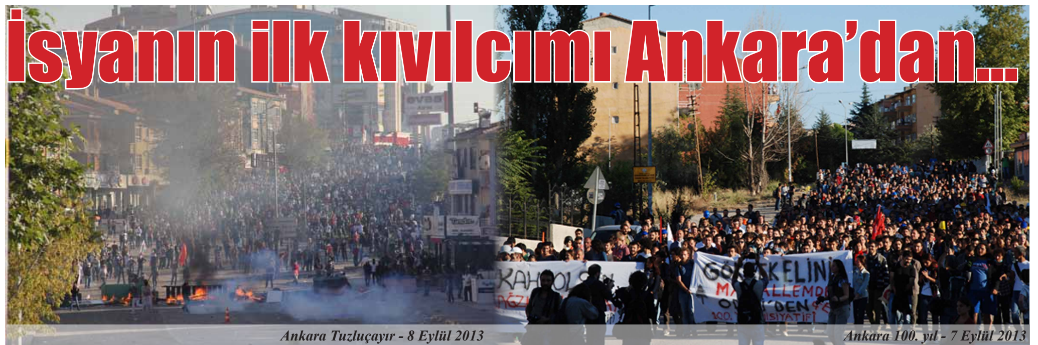
Ankara Tuzlucaıyır - 8 Eylül 2013

Sonbahardan başlayarak tüm öğrencilere ve üniversite emekçilerine mücadele ve başarılarla dolu, paranın, satırın ve copun üniversiteden kovulduğu bir eğitim öğretim yılı dileriz.