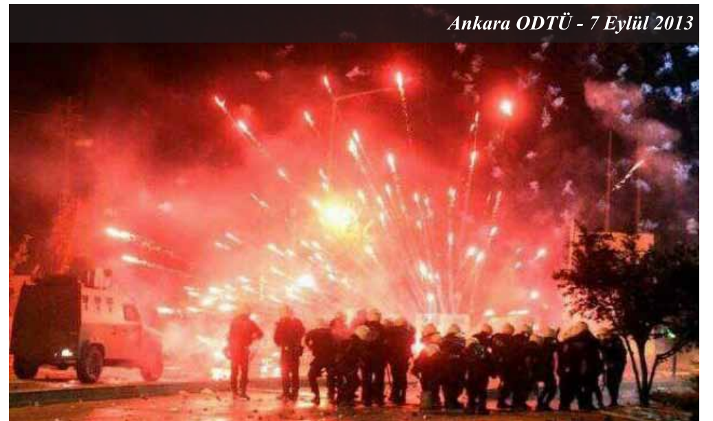
Ankara ODTÜ - 7 Eylül 2013