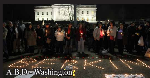
A.B.D - Washington