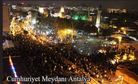
Cumhuriyet Meydanı Antalya