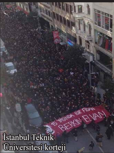
İstanbul Teknik Üniversitesi korteji