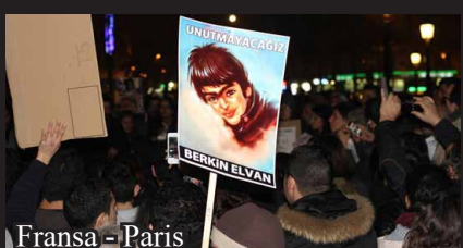
Fransa - Paris