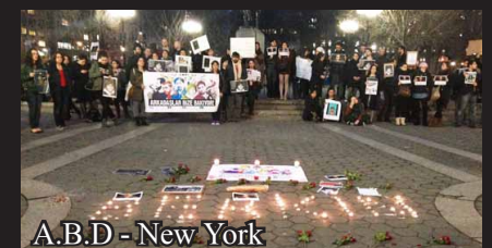
A.B.D - New York