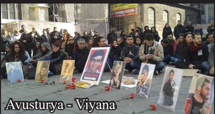
Avusturya - Viyana