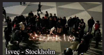
İsveç - Stockholm