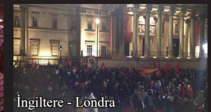
İngiltere - Londra