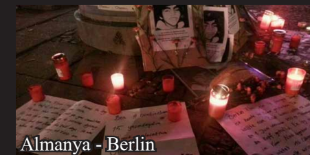
Almanya - Berlin