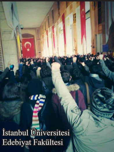
İstanbul Üniversitesi Edebiyat Fakültesi