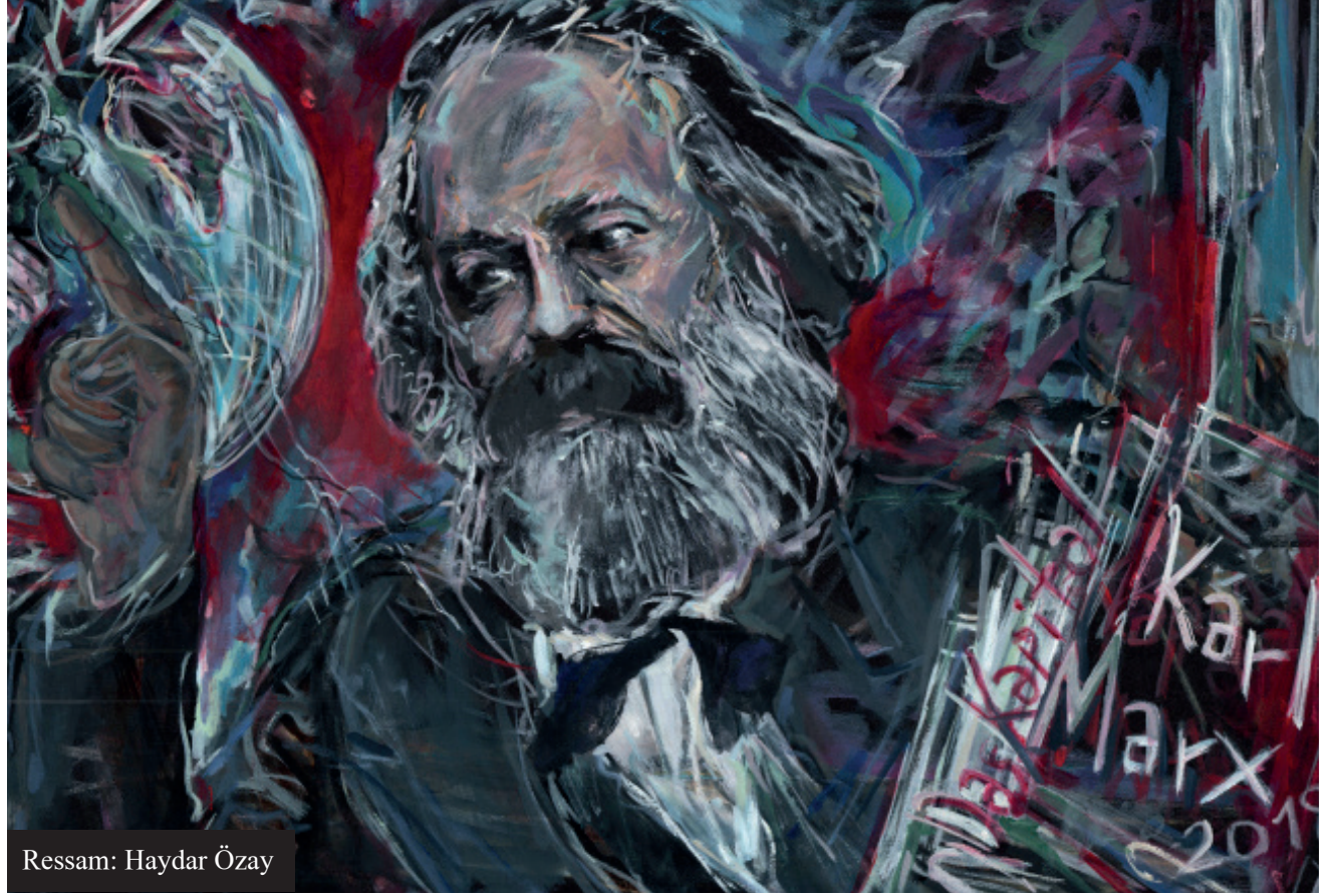
Ressam: Haydar Özay

O yaşamamış olsaydı, dünya farklı bir yer olurdu. İnsanlık onunla öğrendiği ve bütün olumsuz koşullara rağmen hiç unutamadığı hakikatlerin farkına çok daha sancılı, çok daha geç, çok daha büyük bedeller ödeyerek varırdı.