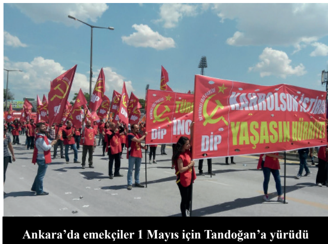
Ankara'da emekçiler 1 Mayıs için Tandoğan'a yürüdü

DİP'in 1 Mayıs alanlarındaki bir diğer gündemi ise AKP ve MHP'nin seçimi kaçırma girişimi ile 24 Haziran'da ilan etmiş olduğu baskın seçimdi. Devrimci İşçi Partisi "Cumhurbaşkanı, patron partilerine, işçi düşmanlarına, NATO'culara, İsrail dostlarına oy yok" sloganlarıyla partinin bu süreçte alacağı tutumu alana yansıttı.