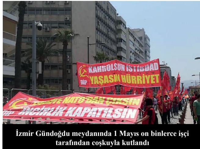
İzmir Gündoğdu meydanında 1 Mayıs on binlerce işçi tarafından coşkuyla kutlandı