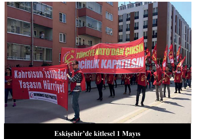
Eskişehir'de kitlesel 1 Mayıs