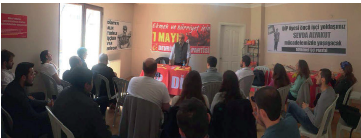
Çorlu'da DİP Genel Başkanı Sungur Savran'ın katılımıyla 1 Mayıs etkinliği