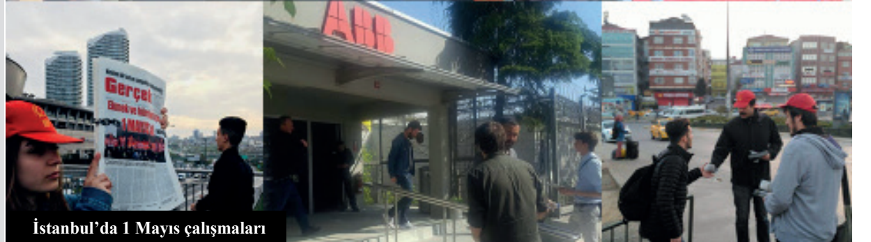
İstanbul'da 1 Mayıs çalışmaları