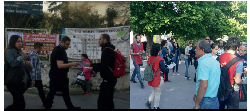
DİP bulunduğu illerde üniversite öğrencilerini ve emekçilerini 1 Mayıs'a çağırıyor

da işçi sınıfının kendi çıkarlarını savunmak için de, AKP'yi iktidardan düşürmek için de öteki düzen partilerinden medet umamayacağını belirtti. Erdoğan'ın en sıkıştığı anlarda, Gezi ile başlayan halk isyanında, 17-25 Aralık sürecinde ve 7 Haziran'da bunun defalarca kanıtlandığını ifade etti. İşçi sınıfının bugünden bütün düzen partilerinden bağımsız şekilde, kendi sınıf partisinde mevzilenerek, örgütlenerek ancak bugünkü istibdad rejimine son verebileceğini, o nedenle ekmek ve hürriyet mücadelesinin iç içe geçtiğini anlattı. Savran'ın konuşmasının ardından çeşitli fabrikalardan yoldaşlarımız, işçi arkadaşlarımız fabrikalarında yaşadıkları sorunları anlattılar. İşçi sınıfının birlik içinde ve kendi partisinde örgütlenmesinin gerekliliğini vurguladılar.