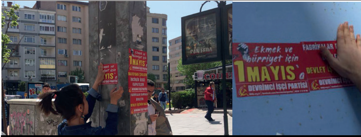
Eskişehir'de valiliğin her türlü siyasi faaliyeti yasaklayan kararı sebebiyle yoldaşlarımız her defasında gözlütına alındı, kentte 1 Mayıs çalışmalarını engellendi