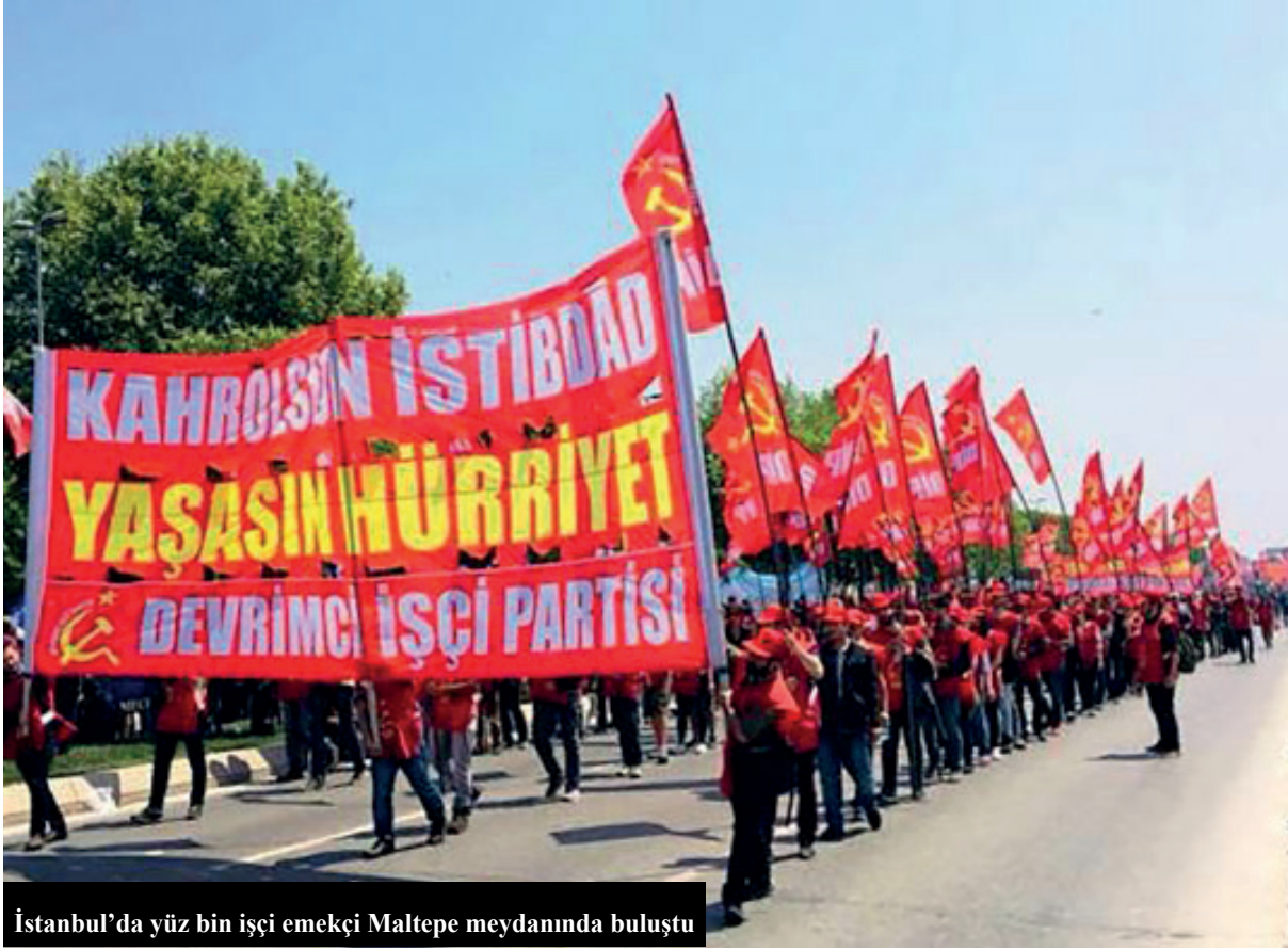
İstanbul'da yüz bin işçi emekçi Maltepe meydanında buluştu

Devrimci İşçi Partisi; mutfağındaki yangın gün be gün harlanan, işsizlik ve düşük ücret kısılacında yaşam mücadelesi veren, hayatı emperyalistlerin kirli savaşlarında pazarlık konusu olan, OHAL bahanesiyle grevleri yasaklanan, istibdadın başta kıdem tazminatı ve sendika hakkı olmak üzere haklarına göz diktiği işçi sınıfına 1 Mayıs'ta ekmek ve hürriyet mücadelesini yükseltme çağrısı yaptı. İstibdada, ekonomik krize, emperyalizme karşı, işçi sınıfının programını ve taleplerini 1 Mayıs meydanlarına taşıdı.