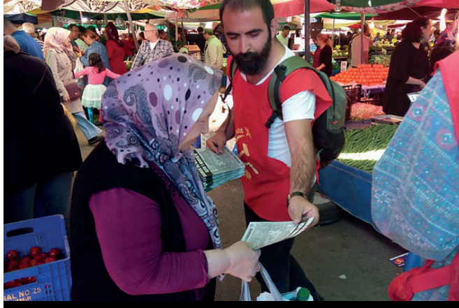
İzmir'de 1 Mayıs çalışmaları