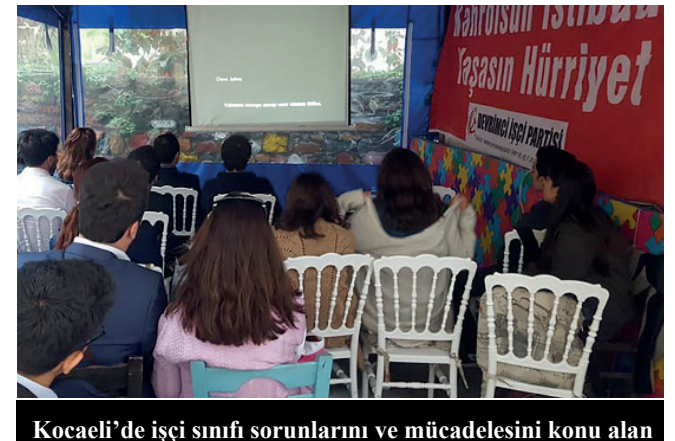
Kocaeli'de işçi sınıfı sorunlarını ve mücadelesini konu alan 'Ben, Daniel Blake' filminin gösterimi yapıldı.