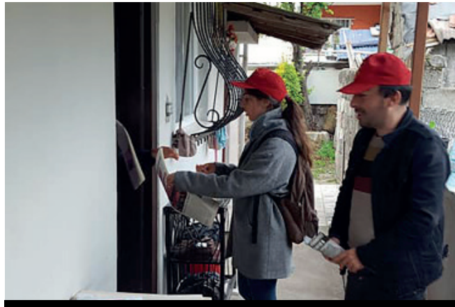
Kocaeli'de 1 Mayıs çalışmaları