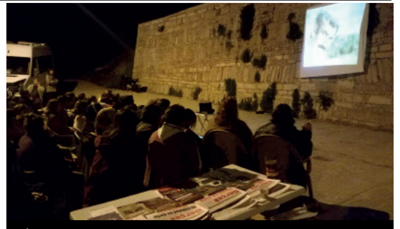
İzmir'de Altındağ Mahallesi'nde Yılmaz Güney'in Arkadaş filminin gösterimi yapıldı