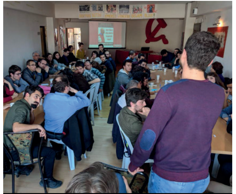
İstanbul'da 1 Mayıs öncesi Gerçek Gazetesi okur kahvaltısı