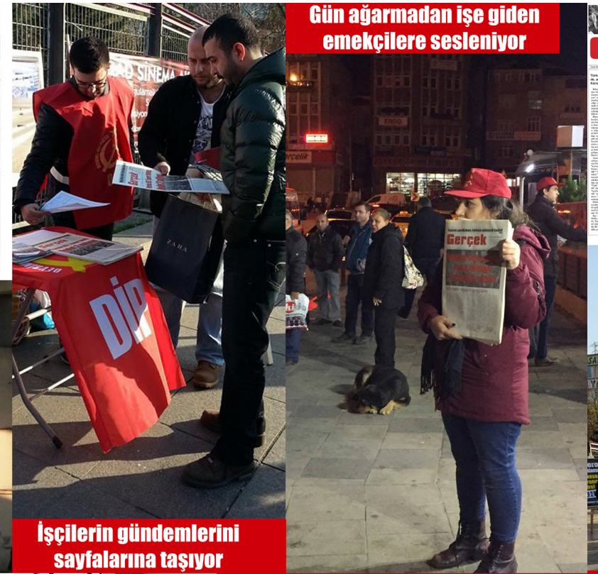
Gün ağarmadan işe giden emekçilere sesleniyor