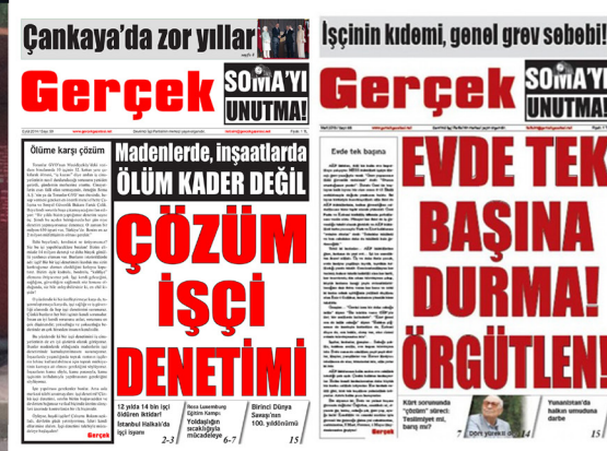
Çankaya'da zor yıllar SO MAYI UNUTMA! İşçinin kıdemi, genel grev sebeb! Türkiye'nin Suriyeleştirilmesine hayır!