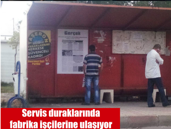
Servis duraklarında fabrika işçilerine ulaşıyor