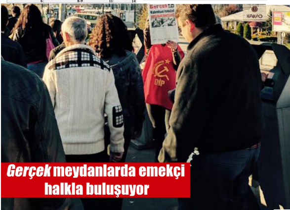
Gerçek meydanlarda emekçi halkla buluşuyor