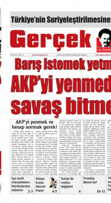
Barış istemek yetmez! AKP'yi yenmeden savaş bitmez! EVDE TEK BAŞINA DURMA! ÖRGÜTLEN!