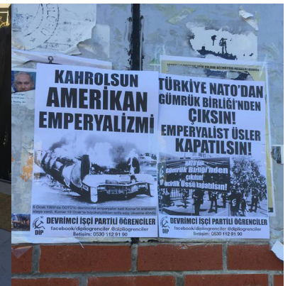
Üniversitelerde Devrimci İşçi Partili Öğrencilerin 6 Ocak çalışmalarından görüntüler