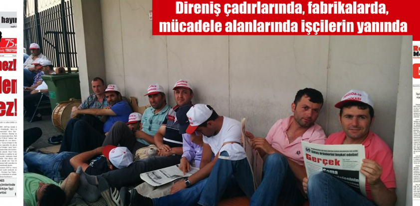
Direniş çadırlarında, fabrikalarda, mücadele alanlarında işçilerin yanında