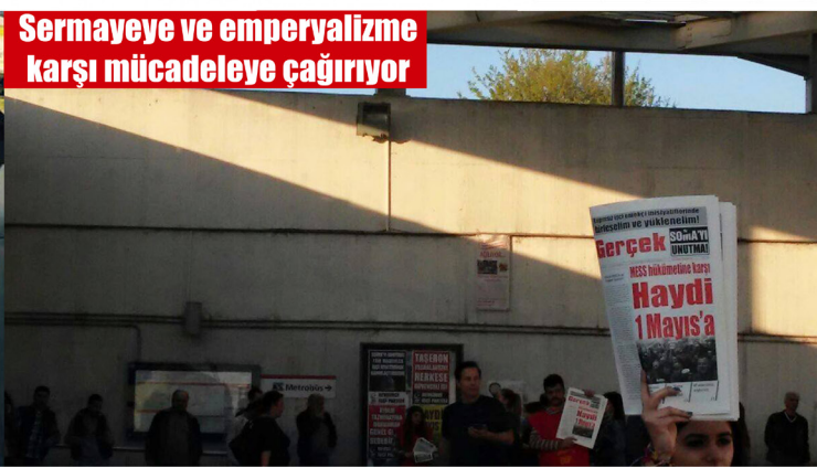
Sermayeye ve emperyalizme karşı mücadeleye çağırıyor