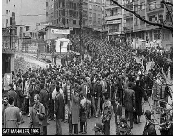
GAZI MAHALLESİ, 1995

1989 Bahar Eylemleri ile başlayan hareketlilikle 90’lı yıllara yükselen bir mücadele dalgasıyla girildi. Aleviler de bu mücadele rüzgarını arkasına alarak hem sınıfının yanında kitlesel işçi mücadelelerinin içinde hem de inançları dolayısıyla yaşadıkları ezilmişliğe karşı bir araya gelerek örgütlendiler. Hacı