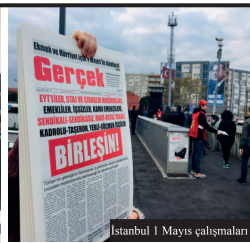
İstanbul 1 Mayıs çalışmaları