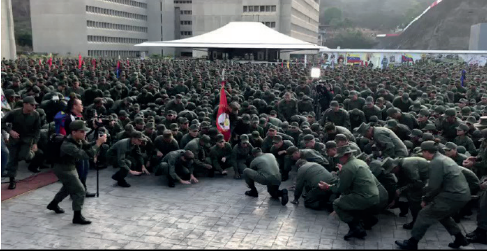
Tiuna kışlasında 4.500 asker Maduro ile birlikte sadakat yemini ediyor.

Venezuela'da 30 Nisan sabahı, kendini ülkenin başkanı ilan etmiş Amerikan kuklası Juan Guaido, birtakım subayları etrafına toplayarak televizyona çıktı, artık iktidarı ele geçirme mücadelesinin son evresine girildiğini açıkladı. Böylece Guaido, Ocak sonunda gerçekleştirdiği sivil darbeyi bir askeri darbe ile tamamlamaya çalışıyor. Bir yandan sanki ordu artık kendisini destekliyormuş gibi açıklama yaparken, bir yandan da halkı sokaklara çağırıyor. 1 Mayıs'ta hem onun taraftarları hem de ülkenin meşru başkanı Nicolas Maduro'yu destekleyen emekçi kitleler kalabalık biçimde toplandı. Bu arada Guaido'nun sokaklara çağırdığı halkı askeri olarak destekleyemediği, ordunun hâlâ Maduro'nun yanında olduğu ortaya çıktı. Yani üç beş askeri birlik kendi yanına geçince darbe yapmış pozuna girmişti Guaido. Buna rağmen 1 Mayıs akşamı halkı yeniden sokağa çağırdı. Ama Perşembe ve Cuma sokaklar bomboştu! Buna karşılık, Maduro 2 Mayıs Perşembe sabahı, Venezuela'nın en büyük kışlası olan Tiuna'da 4.500 subay ve askeri bir araya toplayarak büyük bir gövde gösterisi yaptı, onlarla birlikte sloganlar attı: "Sadakat daima, ihanet asla!"