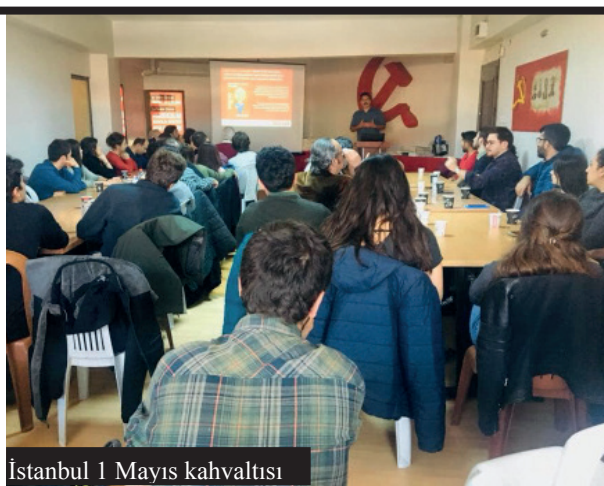
İstanbul 1 Mayıs kahvaltısı