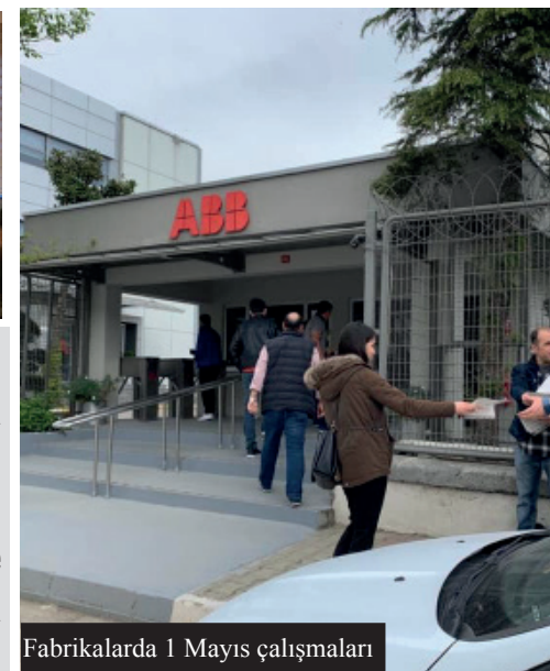
Fabrikalarda 1 Mayıs çalışmaları