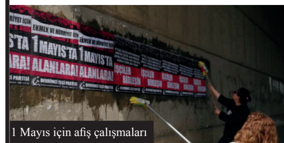
1 Mayıs için afiş çalışmaları