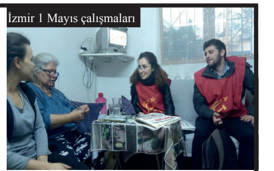
İzmir 1 Mayıs çalışmaları