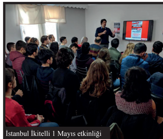
İstanbul İkitelli 1 Mayıs etkinliği

sloganlarımızı haykırdık. AKP'yi devirecek ve istibdad rejimini yıkacak esas gücün işçi sınıfı olduğu bilinciyle yürüyüş boyunca DİP kortejinden pek çok kez "Kahrolsun istibdad yaşasın hürriyet" ve "Hürriyet devrimci işçilerle gelecek" sloganları yükseldi.