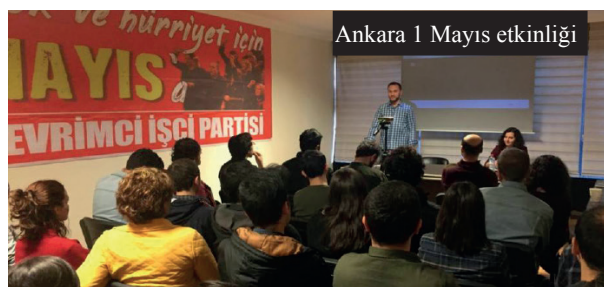
Ankara 1 Mayıs etkinliği