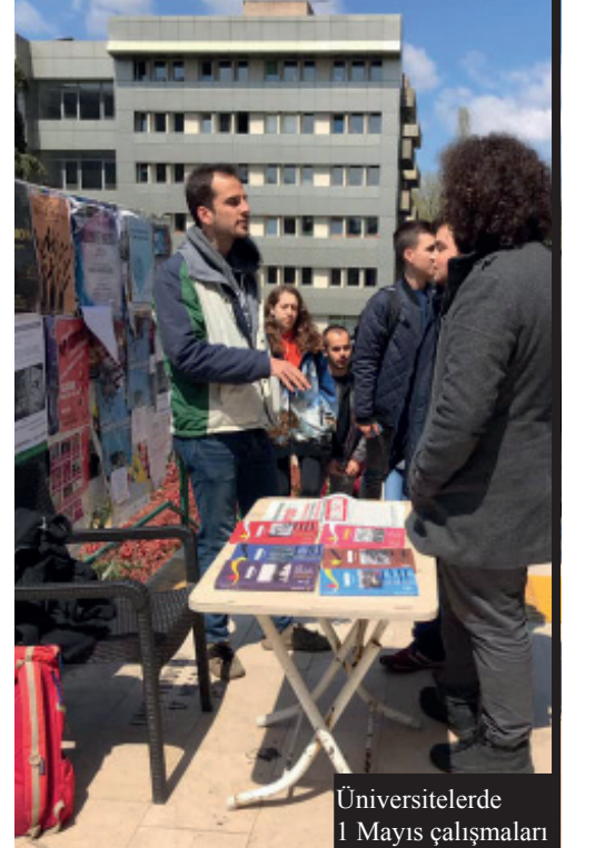
Üniversitelerde 1 Mayıs çalışmaları

Devrimci İşçi Partisi 1 Mayıs öncesinde meydanlarda, fabrika önlerinde, mahallelerde, üniversite kampüslerinde kısacası işçi sınıfının ve emekçi halkın olduğu her yerde yoğun bir faaliyet gösterdi. Bildiri dağıtımları, gazete satışları, afiş çalışmaları ile krizin bedelini patronlara ödetmek, kıdem tazminatını savunmak, emperyalizme ve istibdada karşı ekmek ve hürriyet mücadelesini büyütmek için işçi sınıfını, emekçi halkı ve gençliği 1 Mayıs'a çağırdı.